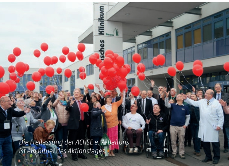
Die Freilassung der ACHSE e.V.-Ballons ist ein Ritual des Aktionstages

Akademisches Lehrkrankenhaus mit Hochschulabteilungen der Medizinischen Hochschule Brandenburg Theodor Fontane